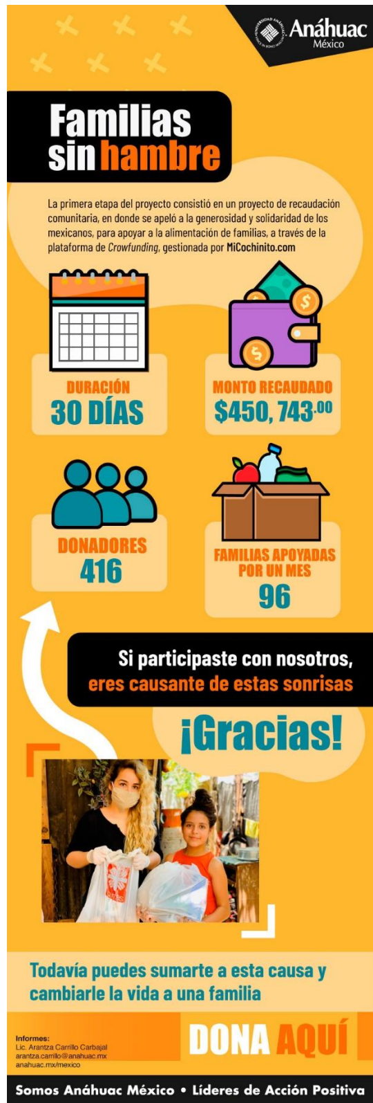
Figura 1.6 Flyer Promocional de Donación Familias sin Hambre.