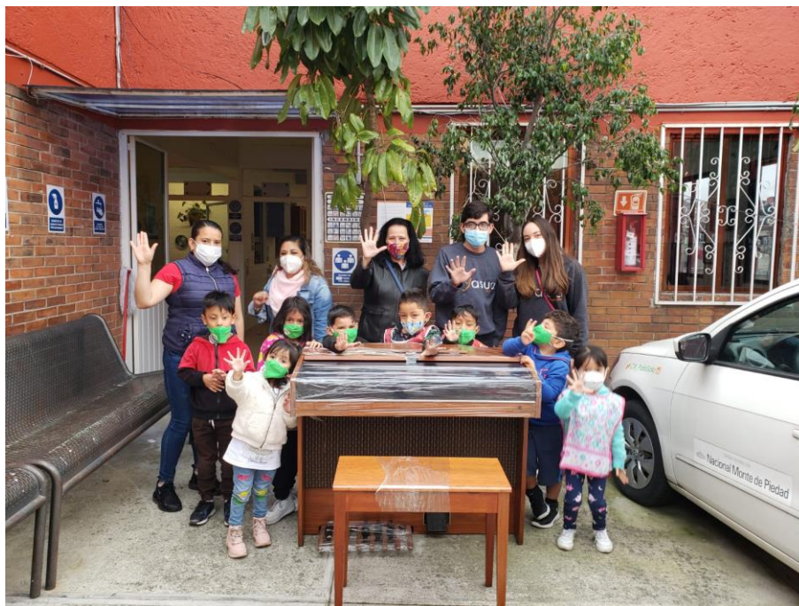
Figura 1.3 Órgano Melódico entregado en donación.

ASEN también colaboró con ASUA y la fundación CADENA durante la temporada de huracanes para hacer acopio de víveres, artículos de aseo personal y de limpieza que las personas de la comunidad pudieran llevar para donar a la universidad Anáhuac que estaba funcionando como centro de acopio.