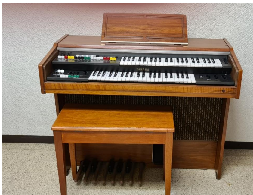
Figura 1.2 Órgano Melódico entregado en donación.

Durante el 2021 se llevó a cabo la donación de un órgano melódico a la Fundación Casa de los niños de Palo Solo. Este material benefició a niños pertenecientes a esta casa de niños que es una población en situación de vulnerabilidad ubicada en el Estado de México.